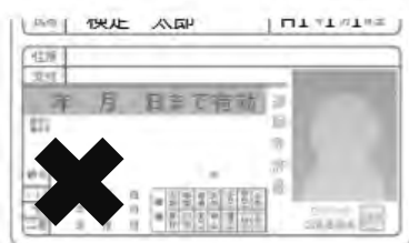
×氏名と生年月日が切れている